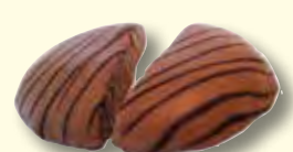
Karamell-Krokant 100 g/Stck.