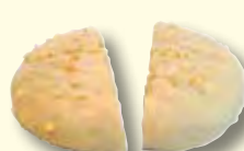
Haselnuss-Nougat 100 g/Stck.